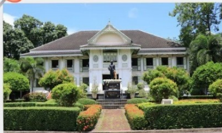
คู่มือเจ้าหลวงเมืองแพร์