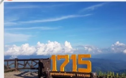
จุดชมวิวที่มีความสูง 1715