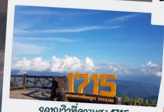
จุดชมวิวที่ความสูง 1715