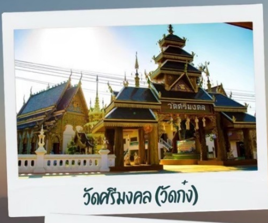
วัดศรีมงคล (วัดก้ง)