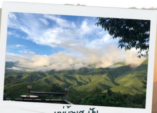
หมู่บ้านสะปัน