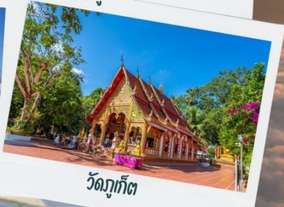
วัดภูเก็ต