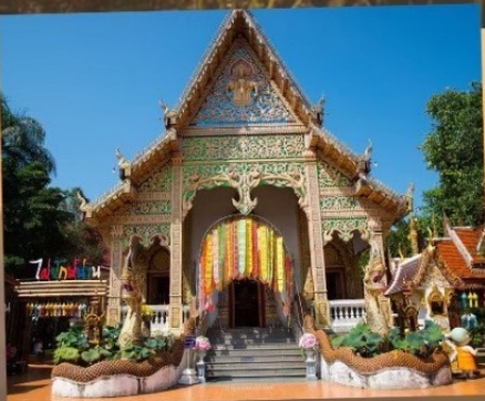
วัดศรีมงคล