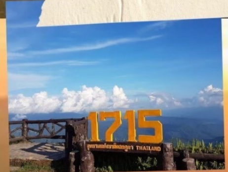
จุดชมวิวกว 1715