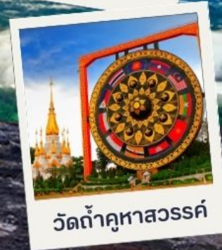
วัดท่าคูหาสวรรค์