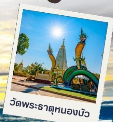
วัดพระธาตุหนองบัว