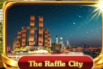
The Raffle City