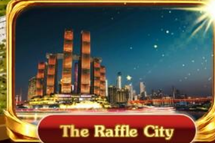
The Raffle City