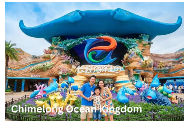
Chimelong Ocean Kingdom

อุโมงค์ใต้มหาสมุทร จอ LED ขนาดยักษ์ที่อยู่ด้านบนบนเหนือศีรษะ ให้ความรู้สึกเหมือนได้อยู่ใต้ท้องมหาสมุทรที่กว้างใหญ่ ได้เห็นถึงความอุดมสมบูรณ์ของระบบนิเวศใต้ท้องมหาสมุทร ความน่ารักของสัตว์น้ำต่างๆ หลากหลายสายพันธุ์ที่แหวกว่ายไปมาตามซอกปะการังสีสันสดใส