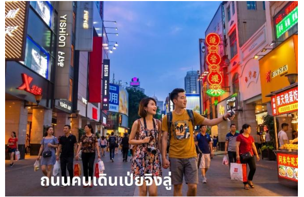
ถนนคนเดินเป่ย์จิงลู่

ให้ท่านได้ ช้อปปิ้ง ถนนคนเดินปักกิ่ง (Beijing Road) เป็นถนนคนเดินที่มีร้านค้าอยู่ทั้งสองข้างทาง เป็นย่านแฟชั่นยอดนิยม มีสินค้าแบรนด์เนมต่างๆ อาทิเช่น เสื้อผ้า กระเป๋า รองเท้า และ ของที่ระลึกอีกมากมาย