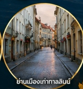
ย่านเมืองเก่าทาลลินน์