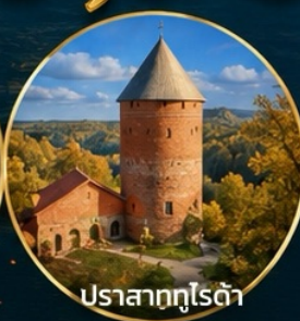
ปราสาทกูโรด้า