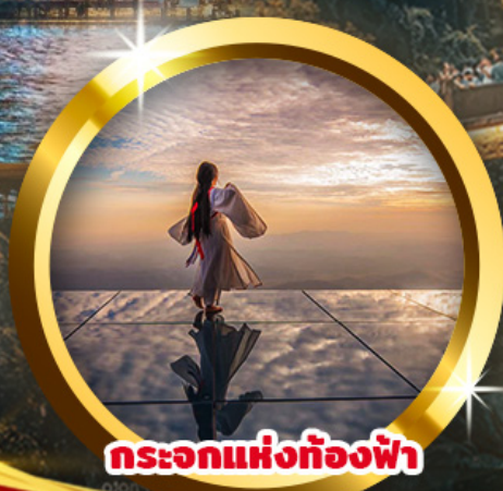
กระเอกแห่งท้องฟ้า