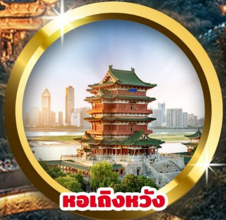
หอเท็งหวัง