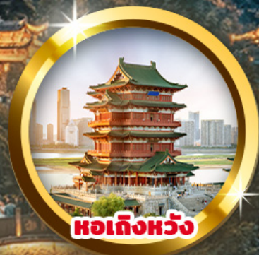
หอเท็งหวัง