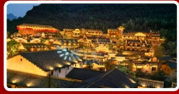
พักในหุบเขาเทวดา