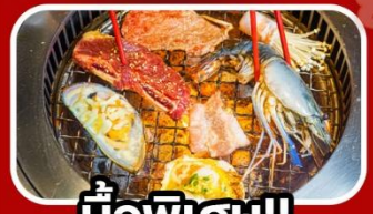
มือพิเศษ!!