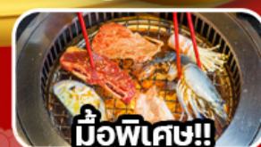
มือพิเศษ!!