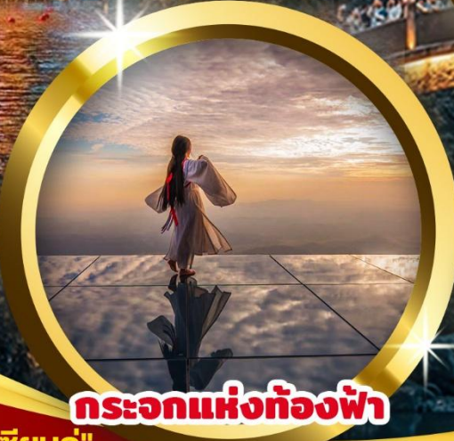
กระบอกแห่งท้องฟ้า