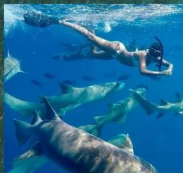
** Nurse Shark Snorkeling