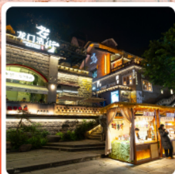
ตลาดโบราณหลงเหมินฮ่าว

ไฮไลท์ อุทยานเขานางฟ้า อุทยานแห่งชาติหลุมฟ้า 3 สะพานสวรรค์ ผาหินแกะสลักตัวจู้ เขาเป่าติงชาน มรดกโลกระดับ 5 A