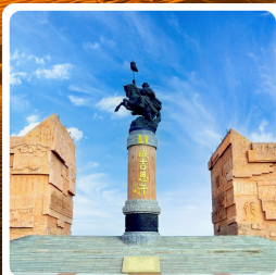
เขตท่องเที่ยวเองกีสข่าน