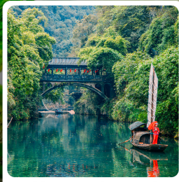
หมู่บ้านชาวน้ำเสียวเสียว