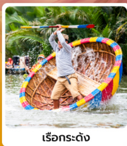
เรือกระด้าง