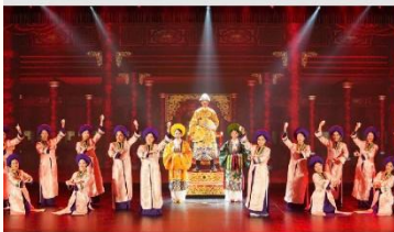
The Heritage Show