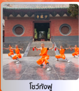
โซ่วกั๋งฟู