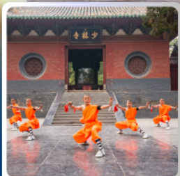
โชว์กังฟู