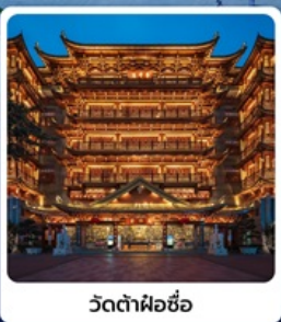
วัดต้าผ้อซือ