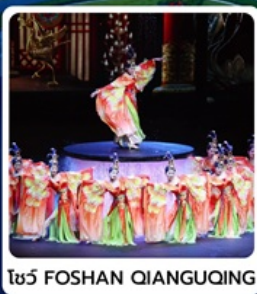
โชว์ FOSHAN QIANGUING