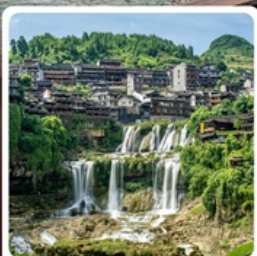
ฝูรงเจิน