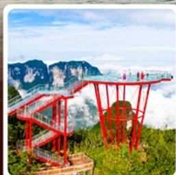
กุหาเจ็ดดาว