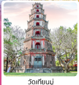
วัดเทียนมู่