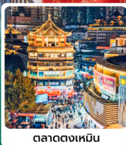
ตลาดตงเหมิน

• โฮเทล OH Bay เป็นแลนด์มาร์คท่องเที่ยวและศูนย์การค้าทันสมัยริมทะเล กวนอูในเซินเจิ้น ขึ้นชื่อเรื่องการช้อปปิ้ง โชคกลาง บาร์มี ความสำเร็จในการทำงาน