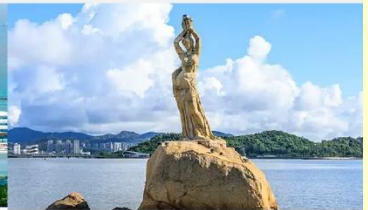
จูไห่ฟิชเชอร์เกิร์ล(หวีหนี่)

*ทางบริษัทฯ ขอสงวนสิทธิ์ในการสลับโปรแกรมทัวร์ตามความเหมาะสมขึ้นอยู่กับสถานการณ์หน้างาน โดยคำนึงถึงผลประโยชน์ของลูกค้าเป็นสำคัญ