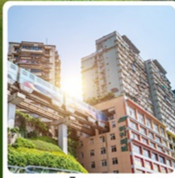
รถไฟทะเลตึก