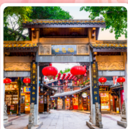
หมู่บ้านโบราณเฉื่อซีโหว่