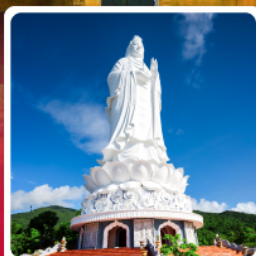
วัดลินฮิ่ง