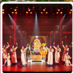
The Heritage Show

• ไอโอล์ก นั้งกระเช้าขึ้นยอดเขาบานาฮิลล์ ชมเมืองโบราณฮอยอัน สักการะเจ้าแม่กวนอิม