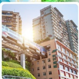
รถไฟฟ้ากระตุ๊ก