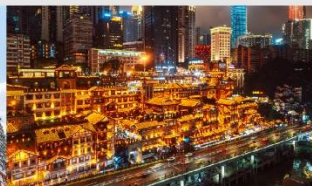
หงหยาดัง(ตอนกลางคืน)

*ทางบริษัทฯ ขอสงวนสิทธิ์ในการสลับโปรแกรมทัวร์ตามความเหมาะสมขึ้นอยู่กับสถานการณ์หน้างาน โดยคำนึงถึงผลประโยชน์ของลูกค้าเป็นสำคัญ