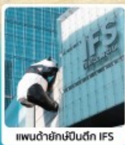
แพนด้ายักษ์เขิงตึก IFS