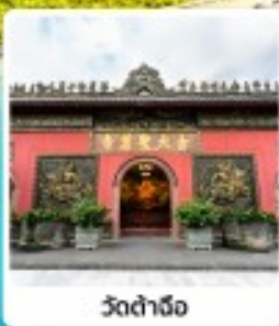
วัดต้าเจ้อ

• ใจโล่ หุ่นเขาวงเจียวโกว สวรรค์บนดิน ณ กุเขาสีดรุณี วัดต้าเจ้อ วัดมหาเมตตา ใจกลางนครเจิงตุ