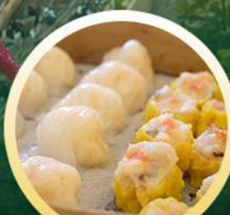
ต้มซ่าฮ่องกง