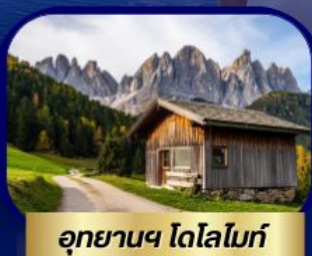
อุทยานฯ โดโลไมท์