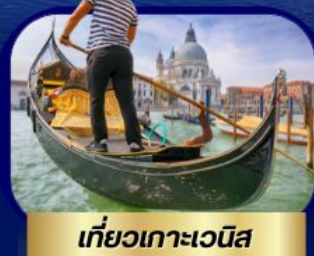
เที่ยวเกาะเวนิส