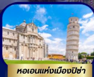
หอเอนแห่งเมืองปิซ่า