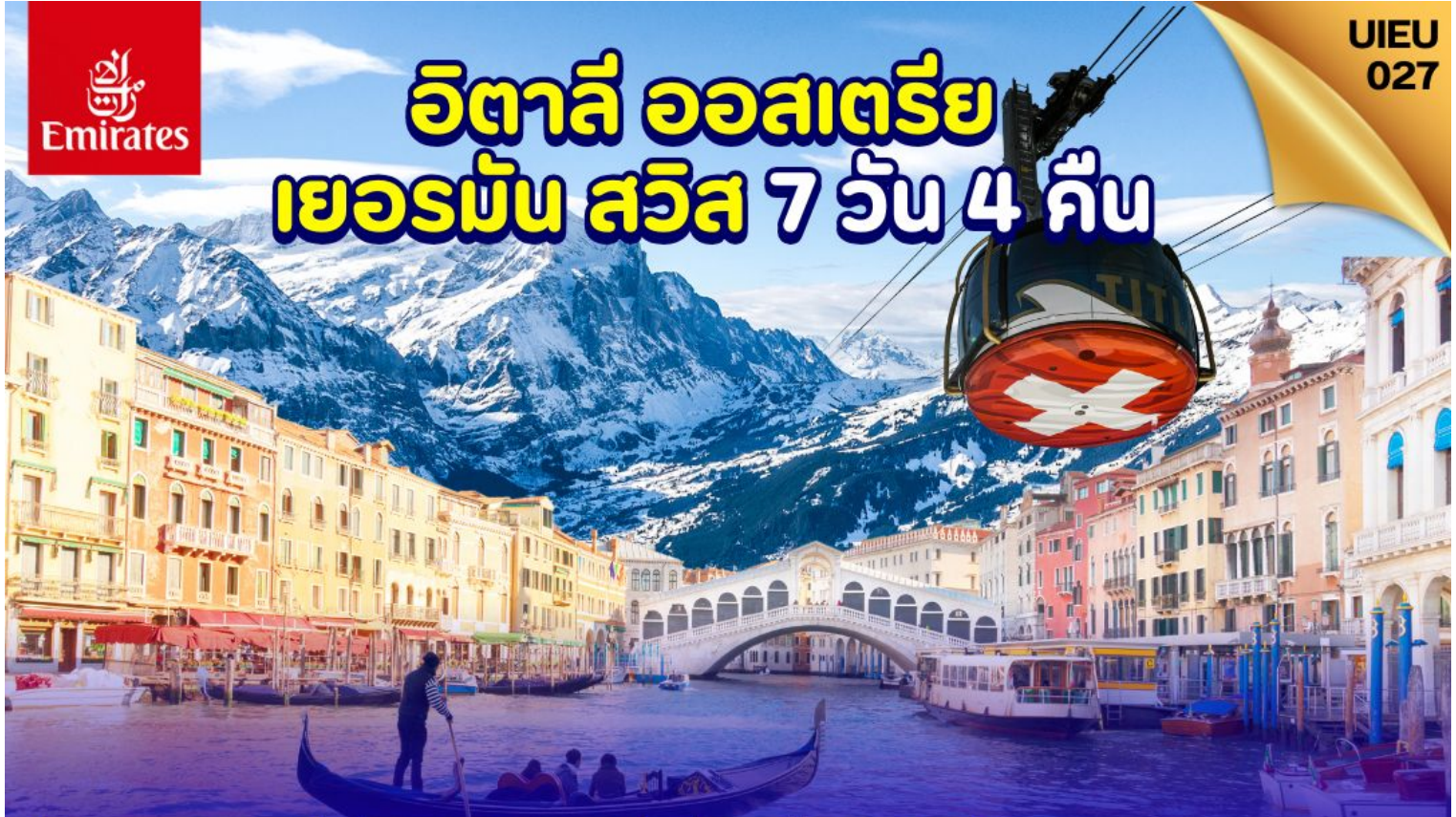
ยอดเขากิตติส