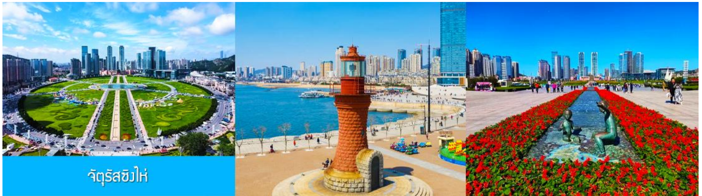
จัตุรัส星海

หลังอาหารนำท่านเที่ยวชมและเก็บภาพ ณ ถนนรัสเซีย 俄罗斯风情街 ในอดีตที่นี่เป็นที่ตั้งของที่ศาลาว่าการเมืองต้าเหลียน ภายหลังได้กลายเป็นชุมชนของพ่อค้าและวิศวกรทางรถไฟชาวรัสเซีย บริเวณนี้จึงเต็มไปด้วยอาคารบ้านเรือนแบบตะวันตก (รัสเซีย) มากมาย นอกจากนี้ได้เก็บภาพที่มีพื้นหลังเป็นอาคารสถาปัตยกรรมตะวันตก ที่นี้ยังมีร้านค้าที่จำหน่ายสินค้าและของที่ระลึกที่นำเข้าจากรัสเซีย อาทิ ช็อกโกแลต เหล้าวอดก้า ตุ๊กตารัสเซีย ฯลฯ