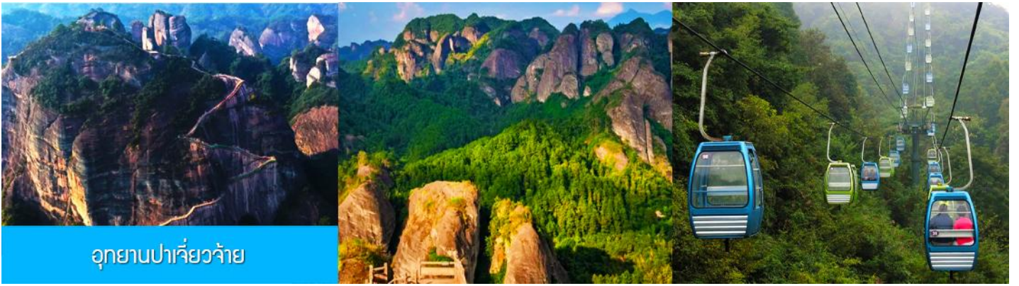
อุทยานปาเจียว้าย

หลังอาหารนำท่านเที่ยวชม อุทยานปาเจียว้าย 崑山八角寨 อุทยานท่องเที่ยวทางธรรมชาติแห่งนี้ ตั้งอยู่บริเวณรอยต่อระหว่างเขตเมืองกุ้ยหลินและมณฑลหูหนาน ประกอบด้วยยอดเขา(หินปูน)ใหญ่รวมแปดยอด มีหกยอดเขาอยู่ในเขตมณฑลหูหนาน ส่วนที่เหลืออีกสองยอดเขาอยู่ในเขตเมืองกุ้ยหลิน มียอดเขาลังซานเป็นยอดเขาหลักที่มีความสูง 818 เมตร มองแต่ไกลดูราวกับหัวมังกรที่เชิดหัวชี้ฟ้า อันเป็นที่มาของคำว่า ปาเจียว้าย (แปลว่า ขุนเขา เขาแปดแท่งหรือเขามังกรแปดหัว)....นำท่านนั่งกระเช้า (ค่าตั๋วรวมค่ากระเช้าขาขึ้นและขาลงแล้ว) ขึ้นสู่จุดชมวิวยอดเขา จากนั้นนำท่านเดินไปตามระเบียงชมวิวเพื่อเที่ยวชมจุดชมวิวต่าง ๆ บนยอดเขา อาทิ จุดชมทะเลหมอก จุดชมปลาวาฬพลิกตัว กองทัพหอยค้ำน้ำฟ้า ฯลฯ และนำท่านสักการะสิ่งศักดิ์สิทธิ์ ณ วัดหยุน ไถชื่อวัดเก่าแก่อายุหลายร้อยปีที่ตั้งโดดเด่นอยู่บนยอดเขา.....เมื่อควรแก่เวลา นำท่านนั่งกระเช้าลงจากยอดเขา