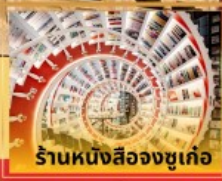
ร้านหนังสือจุกเกอ