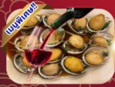
ซีฟู้ด เป้าอ้อโฮปแดง