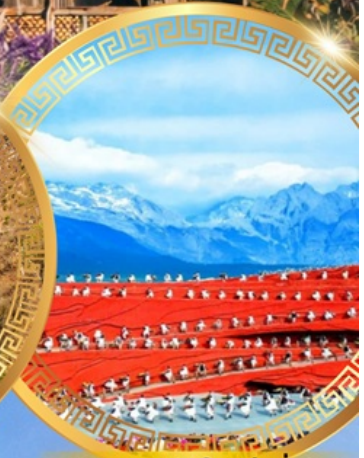
ความประทับใจแห่งลี่เจียง