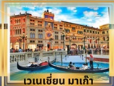
เวเนเซียน มาเก๊า