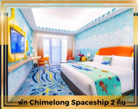
พัก Chimelong Spaceship 2 คืน