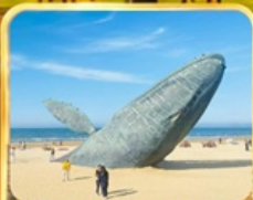
ประมาติกรรมวาฬเกยตื้น