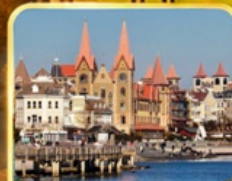
ท่าเรือชาวประมง