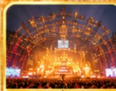
สถานที่จัดงาน เทศกาลเบียร์ชิงเต่า