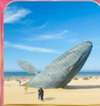
ประติมากรรม "วาฬผู้โดดเดี่ยว"