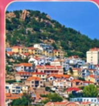
หมู่บ้านชาวประมงซาจื่อโจว