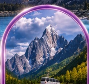
อุทยานสี่ดรุณี (รวมรถอุทยาน)