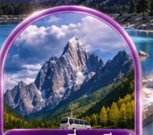
อุทยานสี่ดรุณี (รวมรถอุทยาน)