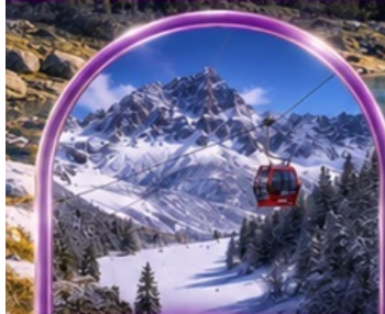
อุทยานต่ากู่ปิงชว่น (รวมรถอุทยาน+กระเช้า)