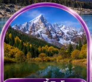
อุทยานปี้ผิงโกว (รวมรถกอล์ฟ)