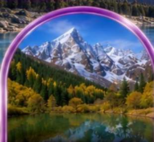
อุทยานปี้ผิงโกว (รวมรถกอล์ฟ)