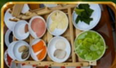
ขนจิ้นข้านสะพาน