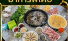
ชาปูเห็ด