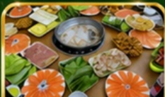
ชาปูแชลมอน