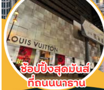
ช้อปปิ้งสุดมันส์ ที่ถนนนคราน