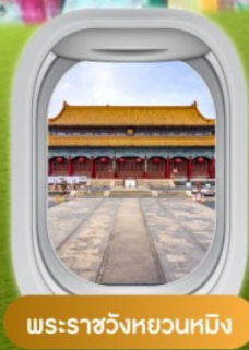
พระราชวังหยวนเหมิง