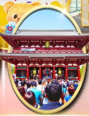
วัตอาซากุสะ