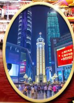
ถนนคนเดินเจี่ยฟางเป็ย