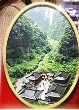
อุทยานหลุมฟ้า สะพาน สวรรค์