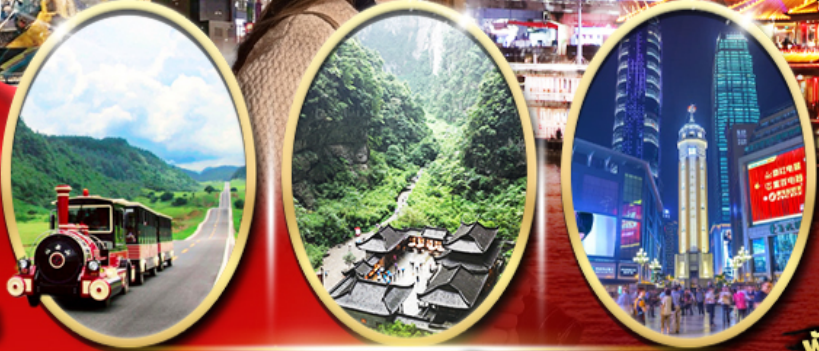
อุทยานเขานางฟ้า อุทยานหลุมฟ้า สะพานสวรรค์ ถนนคนเดินเจียฟางเป็ย

ราคาเริ่มต้น 15,919 บาท รวมภาษีมูลค่าเพิ่ม 7%