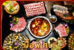
บุฟเฟ่ต์ชาบูสโล่ฮ่องกง