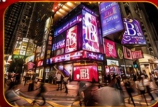
ช้อปปิ้งชิมชาชู้

วัดเจ้าแม่กวนอิมฮ่องกง - ช้อปปิ้งชิมชาชู้ - วัดนาจา วัดแชกงหมิว - วัดหวังต้าเซียน