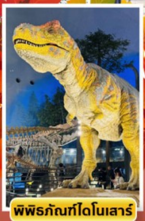
พิพิธภัณฑ์ไดโนเสาร์