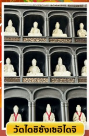
วัดไดชิซังเซอิไดจิ