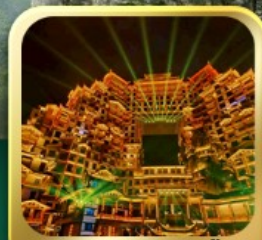
"ตึกมหัศจรรย์ 72 ชั้น"