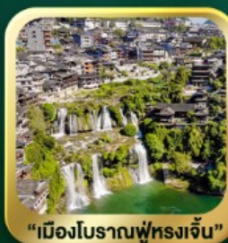
"เมืองโบราณฟูหลงเจิน"