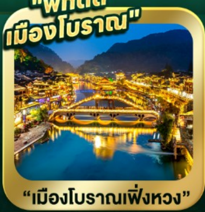
"เมืองโบราณเฟิ่งหวง"