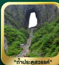
"กำแพงประตูสวรรค์"