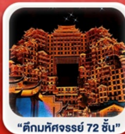
“ตึกมหัศจรรย์ 72 ชั้น”