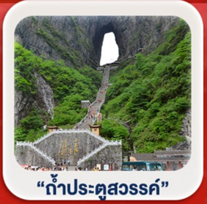
“กำแพงประตูสวรรค์”