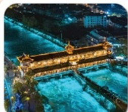
"สะพานหนานเฉียว"