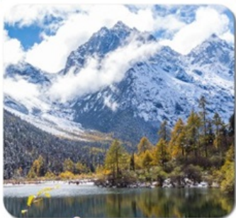
"ปี้เผิงโกว"

ชมความงาม 2 อุทยาน • สี่ดรุณี ของเฉียวโกว + ปี้เผิงโกว • พระใหญ่เล่อซาน สะพานหนานเฉียว น้ำตาสีฟ้า • ห้องสมุดสุดเก๋ จงซูเก๋ • แพนด้ายักษ์บนอนเซลฟ์ ชอยกว้างชอยแคบ • ถนนคนเดินชุนซีลู่ • แพนด้ายักษ์ปีนตึก • ถนนคนเดินจินหลี่