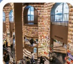
"ห้องสมุดจงซูเก๋"