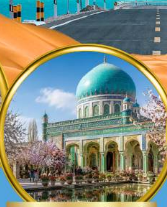
สุสานสมมหอมเซียนเฟย