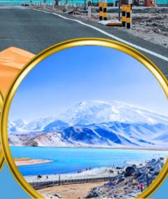
Kala Kule Lake