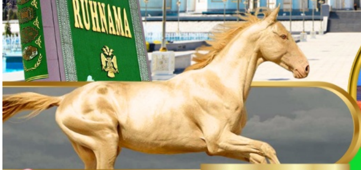
Akhal Teke Horse