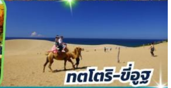
ทตโตริ-ซ็องสุ