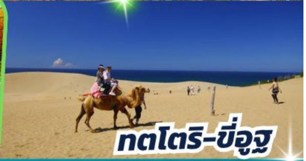
ทตไตร-ซ็อง