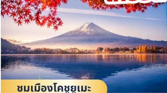
ชมเมืองโคชูยูเมะ