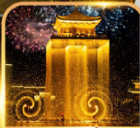
ชมโชว์อุ้มน้ำโจว